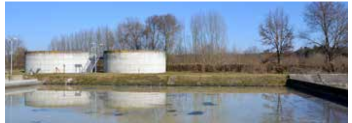
Die Kläranlagensanierung in Winden (Foto) kann starten: das Gremium genehmigte die endgültigen Planungen auf der letzten Sitzung.

Bericht aus der Marktgemeinderatssitzung Ja zur Planung für die Kläranlagensanierung Winden Planung zur Mischwasserbehandlung in Winden und Langenbruck ebenfalls genehmigt/Gesamtkosten für alle Maßnahmen liegen bei rund 11,3 Mio. Euro Reichertshofen – Nägel mit Köpfen machte das Reichertshofer Gremium beim größten Punkt auf der letzten Sitzung des Marktgemeinderats: es gab ein einstimmiges Ja zu den Planungen für die Sanierung der Windener Kläranlage und die Mischwasserbehandlung in Winden und Langenbruck. Die endgültigen Planungen stellte das beauftragte Ingenieurbüro WipflerPlan aus Pfaffenhofen mit zahlreichen Mitarbeitern vor.