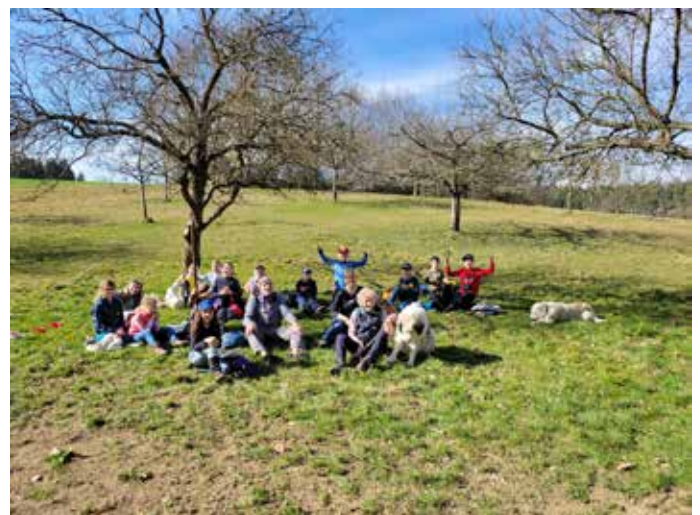
Die Gruppe nach Rückkehr von der Wanderung auf der Streuobstwiese der Oase Steinerskirchen.