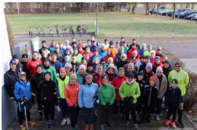
75 Läufer, Walker und Spaziergänger nahmen am diesjährigen 7. Silvesterlauf in Baar-Ebenhausen teil.