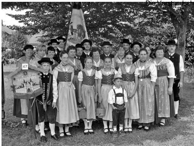
Foto vom letzten Gau-Trachtenfest in Gungolding am 10. Juli