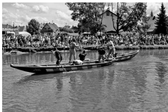
Nach einer Pause im vergangenen Jahr sind Sautrogrennen und Fischerstechen die Höhepunkte beim 42. Paarfest

Den Abschluss des 42. Paarfestes bildet am Montag der Familien- und Kindernachmittag. Er beginnt um 14.15 Uhr mit einem Kinderfestzug vom Rathaus zum Festplatz, der vom "Paartaler Fanfarenzug" begleitet wird. Um 15 Uhr ist im Festzelt das Marionettentheater der Sparkasse Ingolstadt zu Gast, gezeigt wird das Märchen von Hänsel und Gretel. Ab 19 Uhr trifft sich noch einmal alles zum fröhlichen Paarfestausklang beim Tag der Jugend mit der Partyband "Tropical Rain".